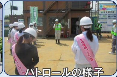
パトロールの様子