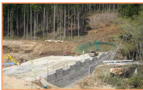
補強土壁の工事中 (平成30年4月撮影)

※「補強土壁」とは、鋼製の補強材とコンクリート製の壁面材とを連結して組み立てた土留め壁です。