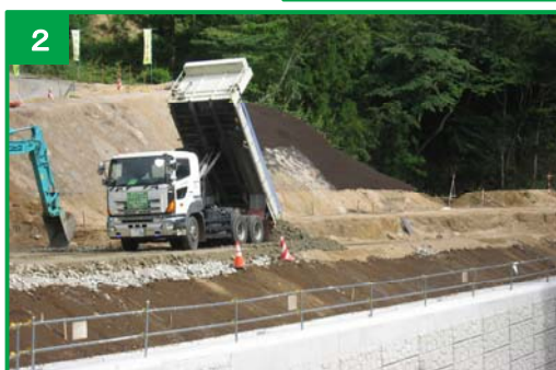
補強土壁の完成状況 (平成30年7月撮影)