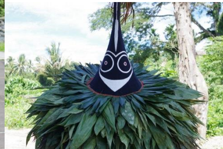
トーライ族の精霊 トゥブアン