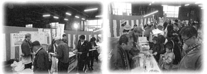
昨年のいただきますキャンペーンの様子