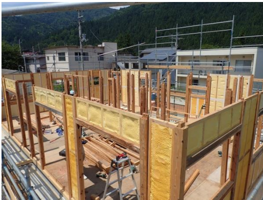
■ 再利用した壁パネル