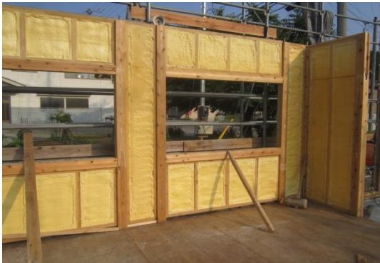
■ 再利用した壁パネル