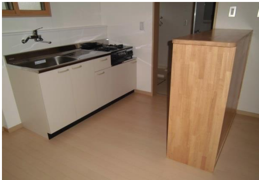
■ ダイニングキッチン