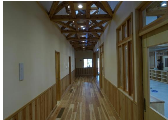
県産材の温もりあふれる園の内部