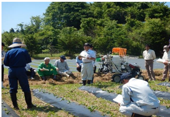
現地検討会（郡山市西田町）

高性能機械により作業の効率化が図られ、サツマイモの生産が拡大されることを期待しています。