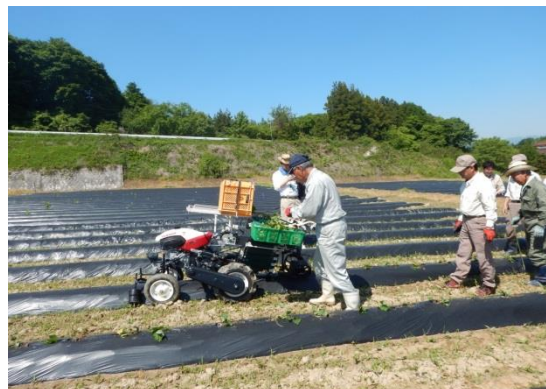
かんしょ移植機による植付けの様子