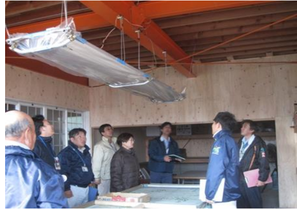
トマトの箱詰作業を行う調整場での取組の様子 (蛍光灯被覆の状況 左：取組前、右：取組後)