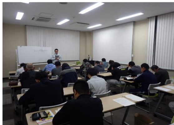
勉強会の様子（JA 夢みなみ玉川支店会議室）