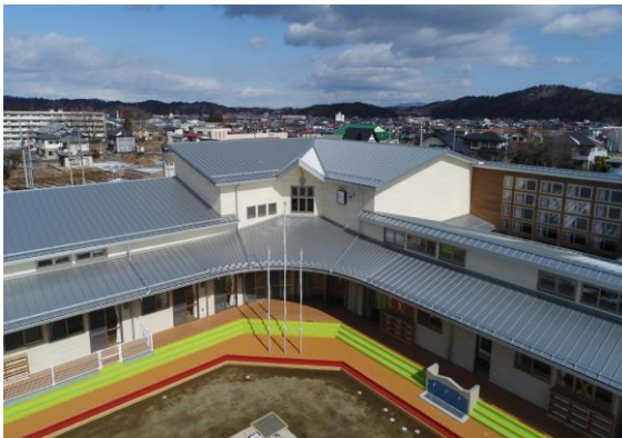
あさかわこども園の外観

施設の完成により、木の良さに対する子供たちをはじめ地域住民の理解が深まり、地域における県産材の利用が一層推進されることが期待されます。