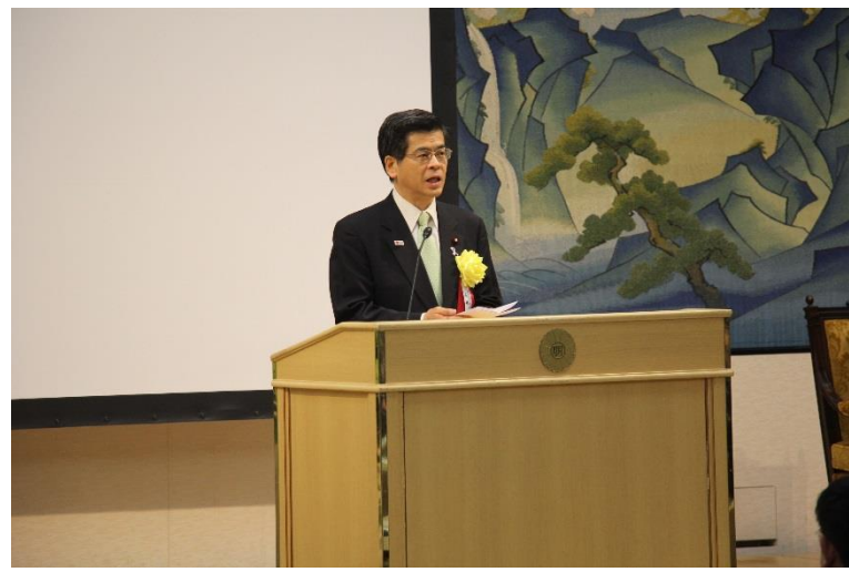
▲来賓で出席された石井国土交通大臣 ▼豊間地区 (H30. 3)