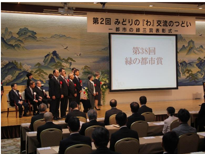
▲「都市の緑三賞」表彰式の様子 ▼薄磯地区 (H30. 3)