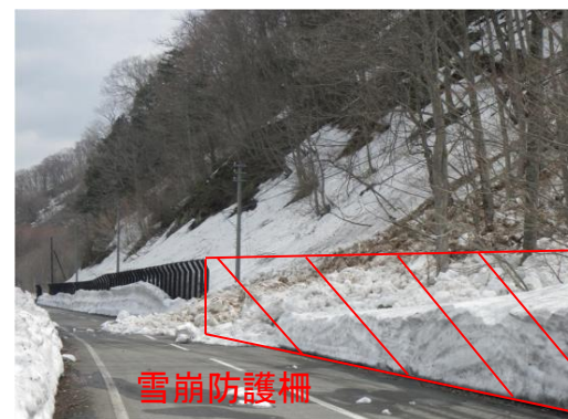
国道352号(檜枝岐村) 至 新潟県