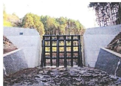
透過型砂防えん堤