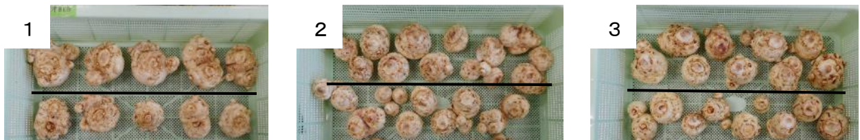
※1:ブラックアイドビューティー、2:クリスタルブラッシュ、3:ゴールドクラウン