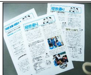
【推進教師発行の研修だより】