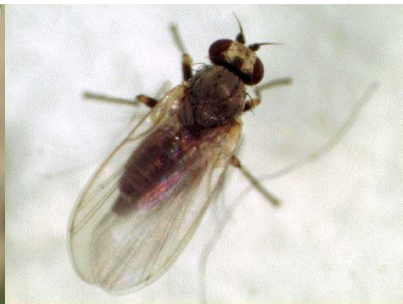
写真6 ナモグリバエ成虫 (接写) (額を除いて灰黒色)