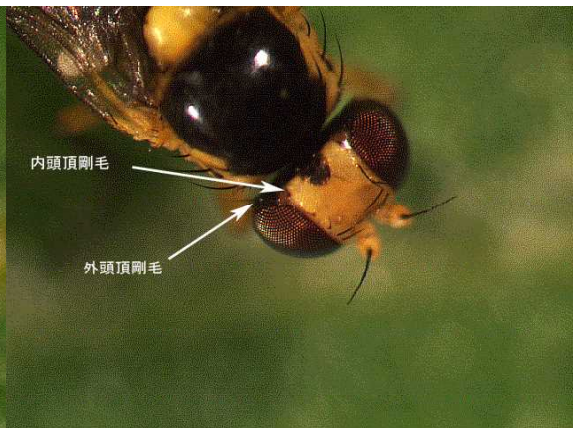
写真14 トマトハモグリバエ成虫頭部 （内頭頂剛毛の着生部が黄色と褐色の境界）