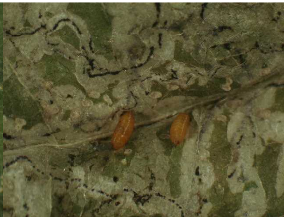
写真12 トマトハモグリバエの蛹