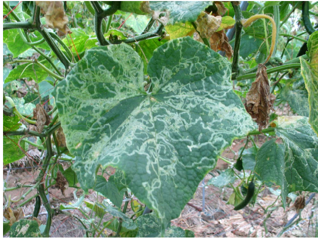
写真10 トマトハモグリバエの被害発生状況（キュウリ）