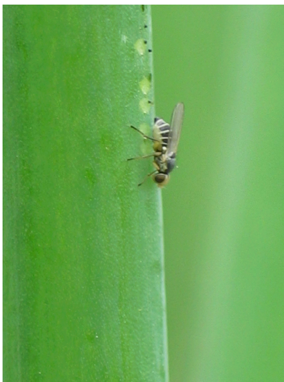
写真15 ネギハモグリバエ成虫

ネギ、ニラ、タマネギ等のネギ類のみを加害する。ネギ類では、秋～冬にかけて収穫するネギやニラが主力であるため、本種はあまり問題になっていない。越冬成虫が5月頃から現れ、年5～6回発生するとされている。本県では9月上旬に調査を行うと、ほぼ全ての株で加害が認められる。