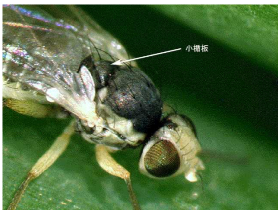
写真16 ネギハモグリバエ成虫（背中の一部小楯板が黒色）