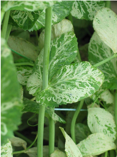
写真3 ナモグリバエの食害痕 (サヤエンドウ)

春期にサヤエンドウ、キクなどで発生する被害は本種であることが多い。盛夏には発生が見られなくなるが、秋期に再び発生が増える。広食性で寄主植物は100種近く、特にエンドウやアブラナ科野菜類の害虫として有名であり、エンドウハモグリバエとも呼ばれる。成虫は体長1.7~2.5mm、黄色の額を除いて頭部から胸背、腹部は灰黒色である(写真6)。また、葉の潜孔内で蛹化する(写真4)ので、成虫か蛹で容易に他種と判別できる。一般には蛹で越冬するが、施設内では幼虫が发育を続け世代を繰り返すことがある。