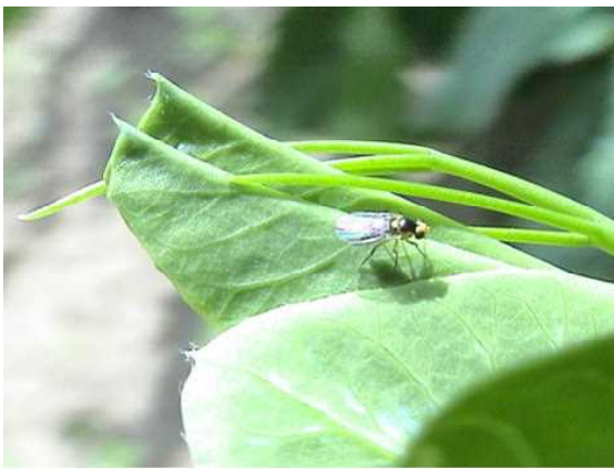
写真7 ナスハモグリバエ成虫

本県では一般に春期から初夏にかけてのトマトなどナス科で多く被害が発生し、盛夏には発生が減少する。幼虫は老熟すると潜孔を脱出し、土中で蛹化する。トマトハモグリバエ、マメハモグリバエと近縁で、形態がよく似ているため肉眼での識別はできない。蛹で越冬するが、施設では冬期間も発生を繰り返す。成虫の体長は1.7~2.0mmほどで、頭部全面と胸部側面から腹部腹面にかけて黄色、胸、腹部の背面は黒色を呈する(写真8)。