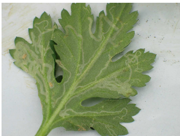
写真2 ナモグリバエの被害葉 (キク)