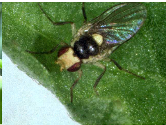
写真8 ナスハモグリバエ成虫 (接写)