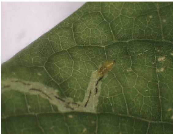
写真11 トマトハモグリバエの幼虫