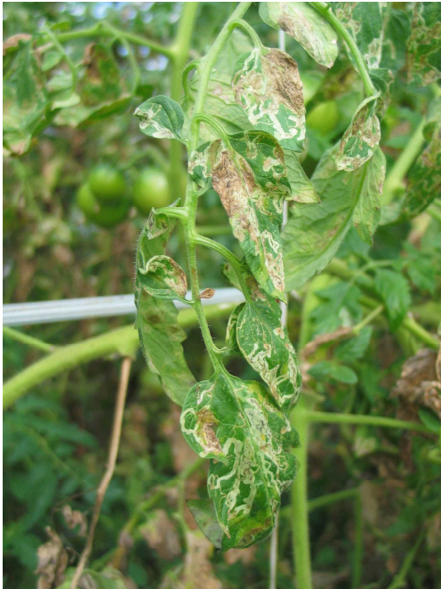
写真9 トマトハモグリバエの被害発生状況（トマト）