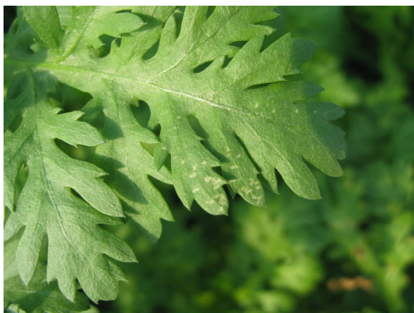
写真1 トマトハモグリバエの産卵痕 (シュンギク)

ナモグリバエの成虫は胸背が灰色、幼虫は葉の潜孔内で蛹化するため判別しやすいが、ナスハモグリバエ、トマトハモグリバエは同じ属 ( Liriomyza 属) で外部形態や生態もかなり似ているため、同定には実体顕微鏡による形態観察や雄交尾器の形状を確認する必要がある。隣県で発生が確認され本県への侵入が警戒されているアシグロハモグリバエや、1994年に本県への侵入を確認したが、近年ではほとんど寄生が見られないマメハモグリバエなども同じ Liriomyza 属 であり判別が難しい。