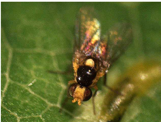
写真13 トマトハモグリバエの成虫