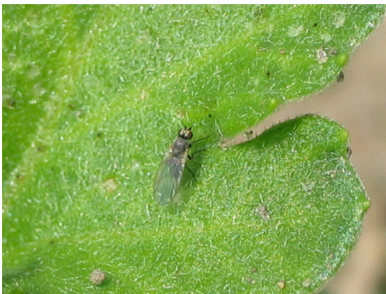
写真5 ナモグリバエ成虫