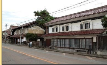
蔵が建ち並ぶ「おたづき通り」の風景

「小田付重要伝統的建造物保存地区」 ・小田付地区に残る、店蔵や水路、道路などの歴史的風致を保存するため、保存区域や保存計画等が平成30年3月に指定されました。