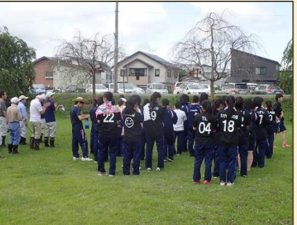
高校生の地元愛に感謝！

◆地元高校生、地域住民との共働…R元.7.1 (喜多方桐桜高校、ご近所にお住まいの皆様) ・参加者約70名、作業延長約300m