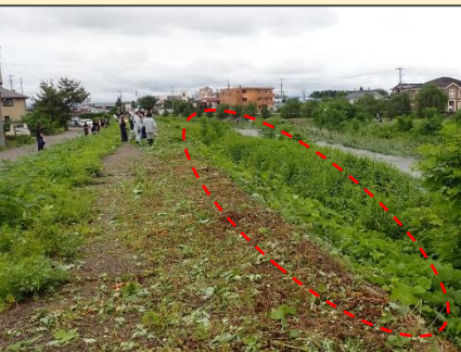
スッキリした作業後の状況