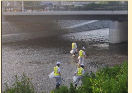
降雨により増水、浸水者も発生

◆地元高校生、地域住民との共働…R元.7.1 (喜多方桐桜高校、ご近所にお住まいの皆様) ・参加者約70名、作業延長約300m