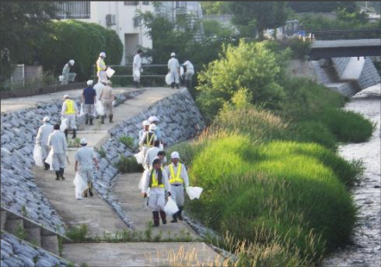
ゴミ拾いに加え、除草作業も実施

◆建設業界との共働…R元.6.26 (建設業協会喜多方支部、測量設計業協会喜多方支部) ・参加者約130名、作業延長約550m