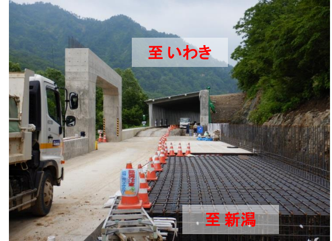
只見町大字叶津地内

令和元年度は、雪崩危険箇所において防雪工(スノーシート、スノーシェルター)の整備を進めております。