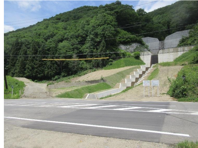
南会津町内川地内

平成30年度までに砂防えん堤と流路工のすべてが完成し、今後は旧施設と工事用道路を撤去して早期完成を図ります。