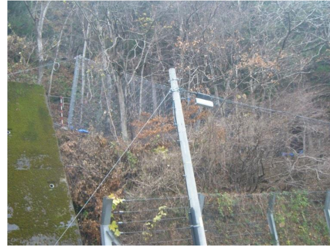
下郷町小沼崎地内

令和元年度は落石を抑えるためのロープネット工等の整備を引き続き整備を進めてまいります。