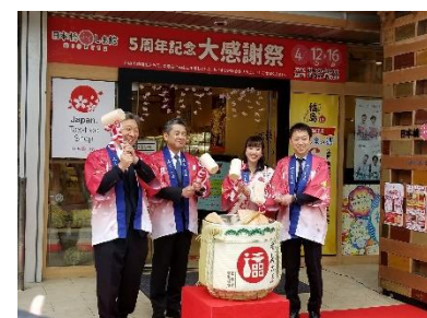
(5周年記念イベント)

風評払拭、本県のイメージ回復、震災の風化防止を図るため、本県のアンテナショップ「日本橋ふくしま館 MIDETTE(ミデッテ)」において、県内団体との連携のもと、復興に向かう「ふくしまの今」等を総合的、継続的に発信しました。