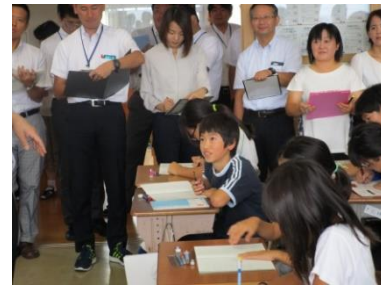
(小学生の授業風景)

本県児童生徒の課題である活用力を育成するため、それに特化した問題を作成して提供しました。また、問題提供を通して、活用力育成のための充実した授業づくりを支援しました。