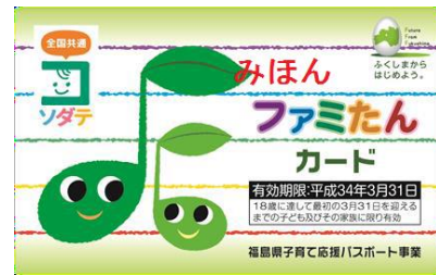
(ファミたんカード)

子育てしやすい県づくりの一環として、協賛企業からの支援サービスが受けられるパスポート(ファミたんカード)を、子育て家庭に交付しました。