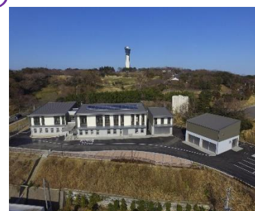
(県水産海洋研究センター)

本県の水産業の復興・再生に向け、魚介類の放射性物質に関する課題等へ対応するための研究施設として、いわき市小名浜に「福島県水産海洋研究センター」を整備しました。