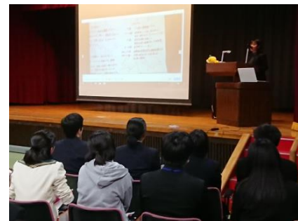
(高校1年生の発表の様子)

新学習指導要領でも求められているアクティブ・ラーニングの視点を各学校の授業に取り入れることにより、新しい時代に求められる学力の向上を図るとともに、各学校の特色や生徒の実態に応じた役割・使命を全面的に支援し、生徒の進路希望の実現を図りました。