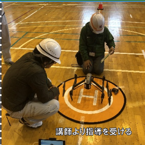
講師より指導を受ける