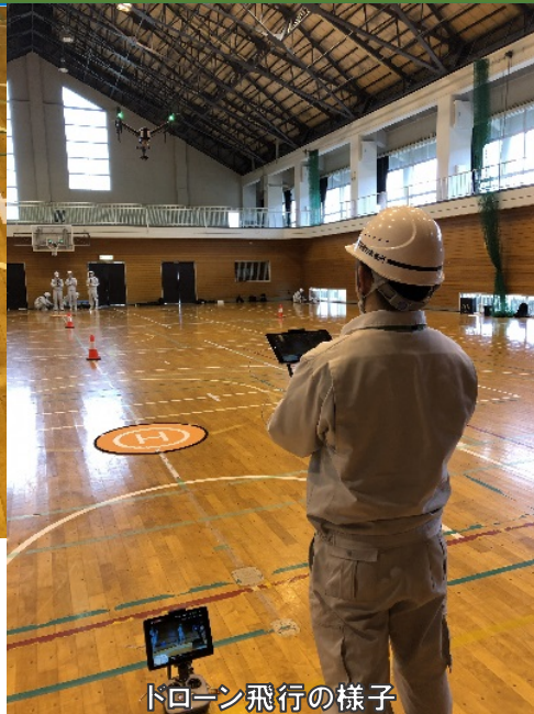
ドローン飛行の様子

4月26日（金）、いわせ地域トレーニングセンターにてドローンの実技試験を受け、相双建設事務所では新たに3名がライセンスを取得しました。