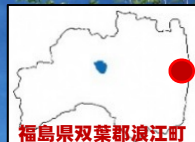
福島県双葉郡浪江町

5月26日（日）に、「（仮）道の駅なみえ」の起工式・安全祈願祭が開催されました。道の駅ができるのは役場のすぐ目の前で、国道6号と浪江インターにアクセスする国道114号との交差点という抜群の立地条件です。フードコートやコンビニエンスストア、浪江町伝統の大堀相馬焼や日本酒の販売もするそうです。県としては、浪江町や国と連携しながら、今後の事業進捗を図ってまいります。