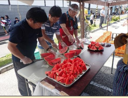
スイカは合庁の雪室で 冷やしたものを使用