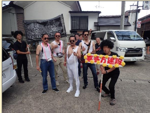
楽屋の外で気合いを入れ、まずは記念撮影。後ろのハイスがバンドマン気分を盛り上げる。