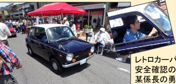
レトロカーパレードに参加しつつ 安全確認のため道路パトもこなす 某係長の勇姿