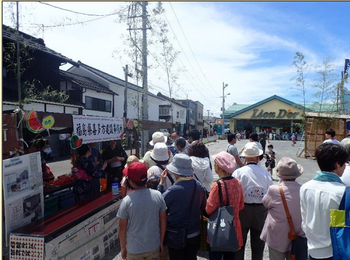
準備中から大行列となり、事務所ブースは大盛況！ 雪室の中は湿度100%で温度変化が少ない空間であるため、鮮度を保ったまま糖度が増し、みずみずしく甘いスイカを提供できます。