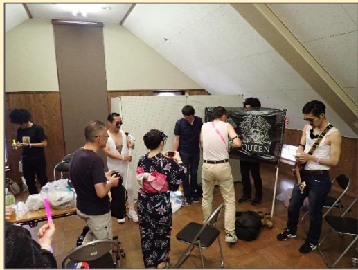
楽屋での一コマ。ブレイクストーミングと反復練習。あのパフォーマンスは、ここから始まった。