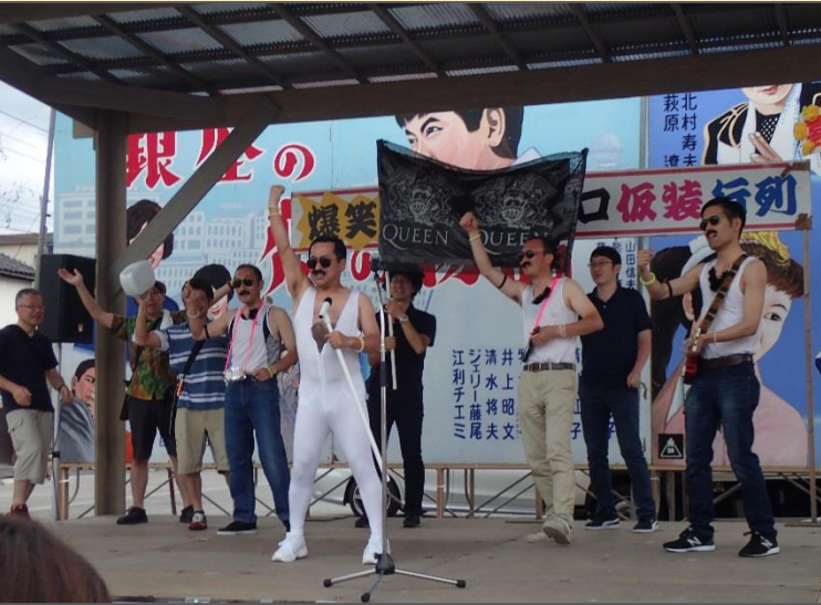
ステージ上での一コマ。握手や写真撮影を求められた数100人超。「本物よりも本人らしい」「過去最高のパフォーマンス」「建設事務所も大変だね」などの声が寄せられました。結果、「優秀賞」受賞！！