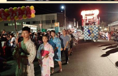
地元の方々と輪となり、「ふれあい通り」を移動しながら1時間踊り続ける庄助踊り。地域の方々との親交を深めることができました。