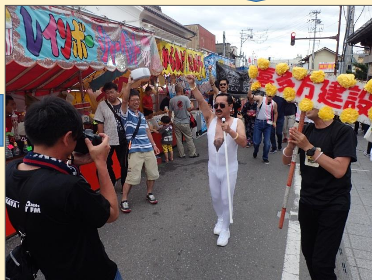
沿道の群衆、そして露店の売り子。周囲の全てを巻き込んだ圧巻のパフォーマンス。ふれあい通りは、あの「We Will Rock You」の大合唱に包まれました。「地域と一体になった瞬間」だと思いたい…。