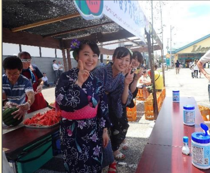
女性陣は浴衣姿でおもてなし