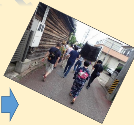
楽屋を出て会場へ続く小路の一コマ。足取りは何故か重い…。が、この道中で気持ちは定まった。