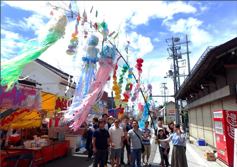
早朝とはいえ猛暑のなか、七夕飾りの飾り付けを実施 職員一人一人の願いをこめた短冊を飾りました。