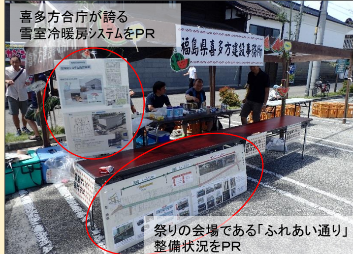
喜多方合庁が誇る 雪室冷暖房システムをPR