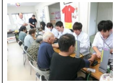
地域医療体験研修事業