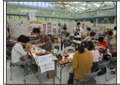
いわき大交流フェスタ （避難者等と地元住民の交流ブース）