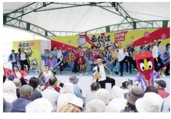
ふたばワールド 2018in なみえ