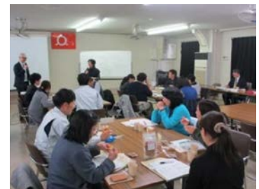
地域産業 6 次化の推進