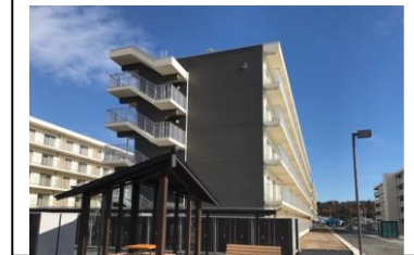
復興公営住宅（南相馬市）