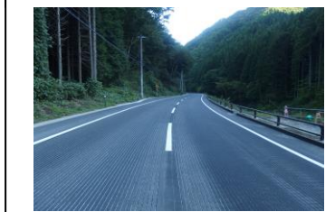
小野富岡線(五枚沢1工区) 平成30年9月28日開通