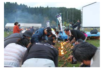
地域づくり活動支援