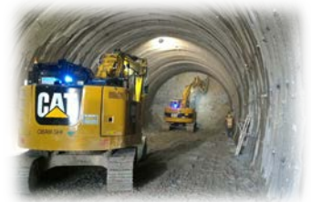
道路(トンネル)工事