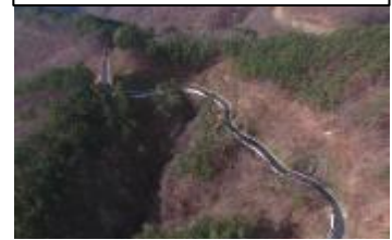
森林管理道の整備