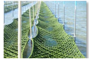
青のり養殖の復活（相馬市）