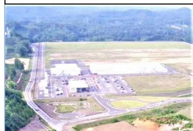
工業の森・新白河B工区