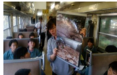
JR只見線学習列車の様子