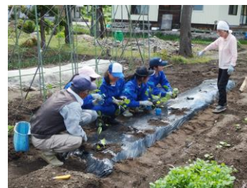
教育旅行（農業体験）の様子