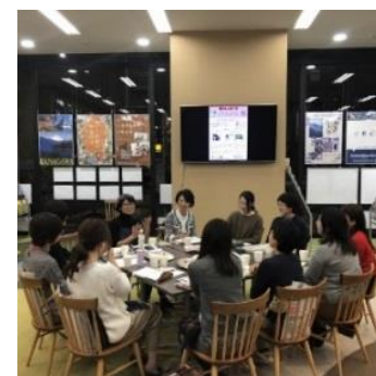
農家民宿モニターツアー