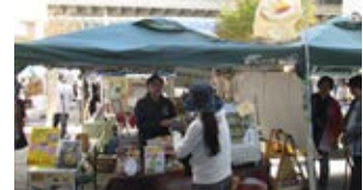
首都圏でのPRイベント