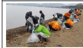
猪苗代湖漂着水草回収