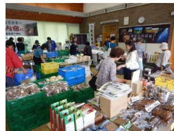
南会津ふるさと物産展 in八王子滝山