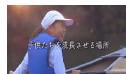
おいしい ふくしま いただきます! キャンペーン