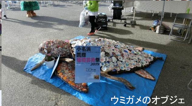
ウミガメのオブジェ