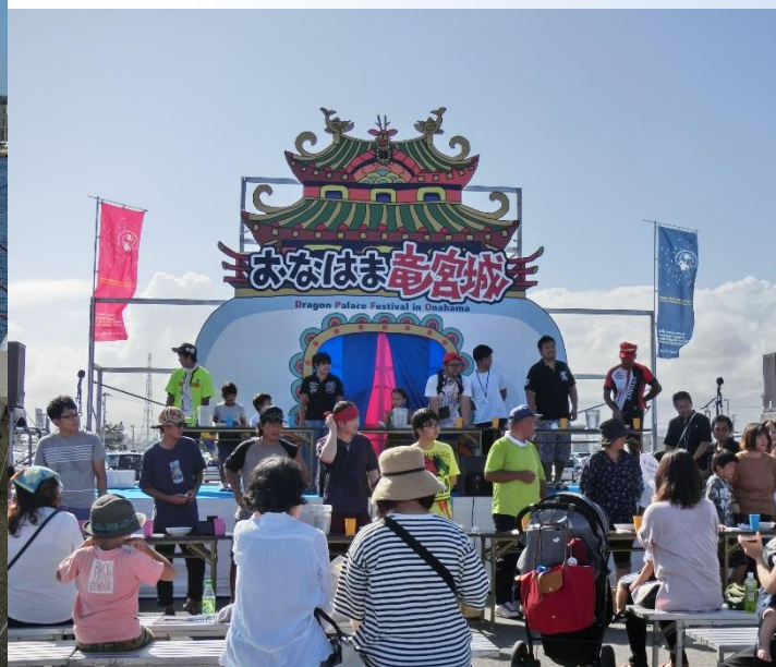
カジキメンチ大食い大会