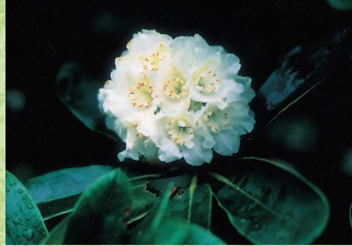
県の花：ネモトシャクナゲ