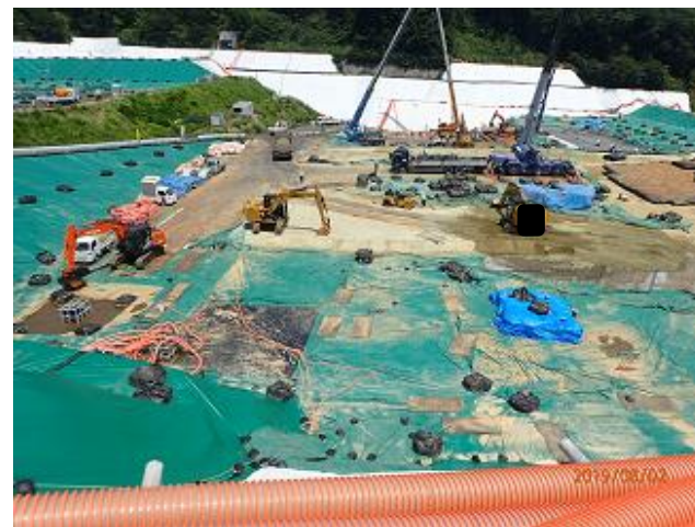
下流側埋立地の埋立状況の確認