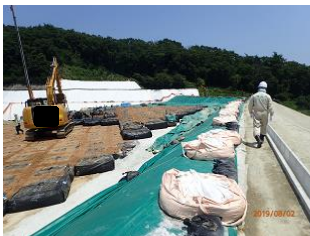
下流側埋立地の埋立状況及び土堰堤の確認