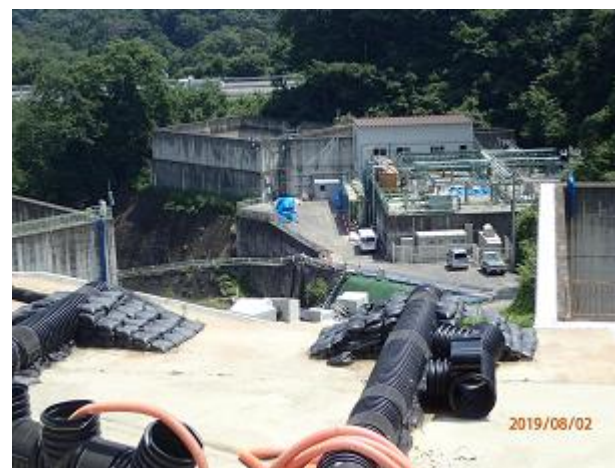
浸出水処理施設の稼働状況の確認