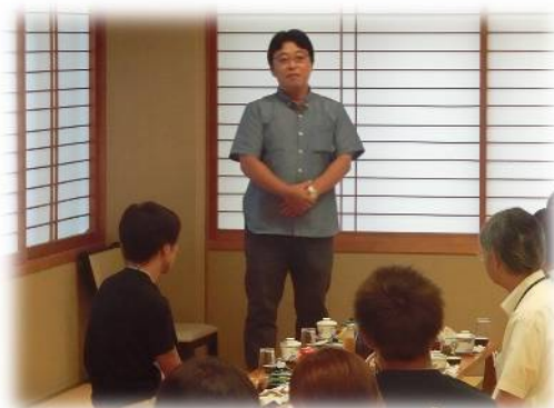
金山町国民健康保険診療所 押部先生 あいさつ