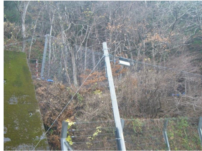
下郷町小沼崎地内

令和元年度は落石を抑えるためのロープネット工等の整備を引き続き整備を進めてまいります。