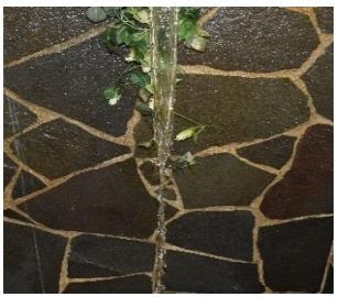
湧き出す源泉を利用した打たせ湯。双葉郡屈指の良質なお湯を贅沢に味わえる。