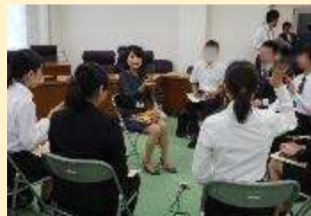
<職員への質問タイム>