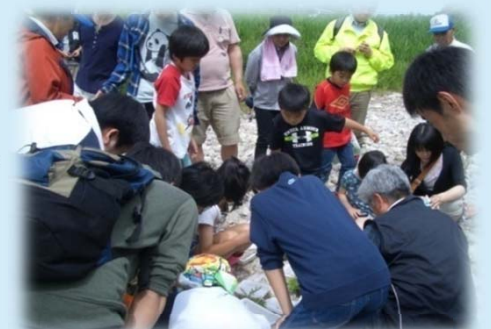
夏井川 水生生物調査