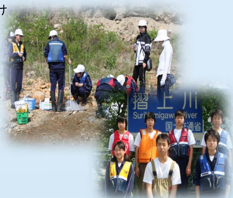
生徒・教職員が力を合わせて調査を実施