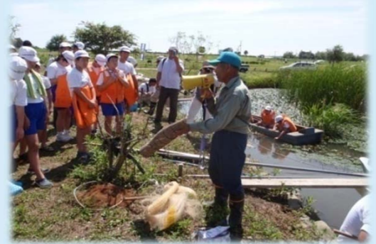
小学校の上下流交流

また、県内の水環境団体が一堂に会し、地域・流域間の交流活動報告、情報交換や今後の活動への助言等を目的とした「福島県水環境活動団体交流会」(平成15年度から開催)や全国規模の「全国河川愛護団体交流会」(昨年まで12回開催)の中心的な役割を果たし、県内はもとより全国規模の交流へ発展し、先進的な活動を実施しています。