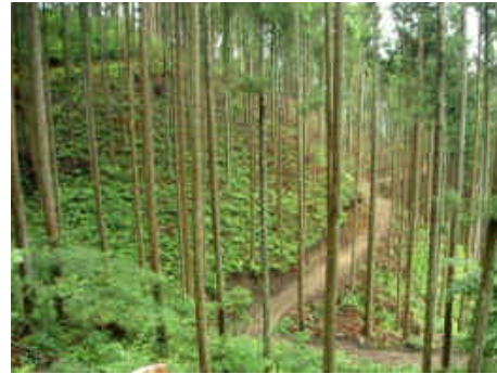
作業路整備（田村市）

【評価】林内作業路等路網の整備支援や運搬支援により、これまで林地に残すことの多かった間伐材が有効に利用されている。また、県民に身近な公共施設等で、間伐材製品が展示利用されたことにより、安らぎの場が創出されるとともに、間伐材利用についての県民の理解促進が図られた。さらに、化石燃料に代わる環境に優しい暖房器具としてペレットストーブの普及が図られ、木質バイオマス利用についての県民理解が促進された。