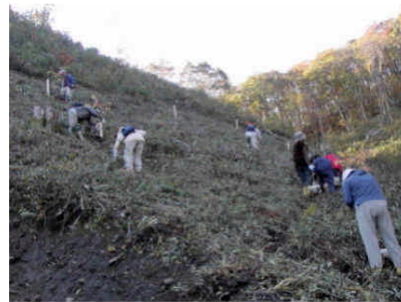
森林ボランティア活動(南相馬市)

【評価】森林環境ゼミナール参加者は1,836名を数えるなど、森林を全ての県民で守り育てる意識を醸成するための活動への参加者は増加傾向にあり、森林の役割や重要性への県民理解が促進されている。また、サポートセンターの設置により森林ボランティア活動の環境が整備されたこと等により、森林ボランティア参加が促進された。県立学校9校では、体験的な森林環境学習の実施により、生徒の森林環境への理解促進や地域と学校の結びつきを深めることに貢献している。