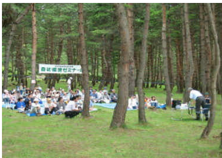
森林環境ゼミナール(猪苗代町)

県民参画の森林づくりを推進するため、県内各地で森林環境ゼミナールが開催された。また、森林環境学習のためのフィールドが8ヵ所整備され、森林の働きなどを学ぶ場として活用された。さらに、森林ボランティアサポートセンターが県民の森(大玉村)に設置され、森林づくりやボランティア団体の活動支援が行われるとともに、企業の森林づくりの参加促進が図られた。加えて、県立学校において、地域と連携し体験的な森林環境学習が行われた。