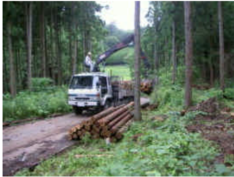
間伐材運搬状況（田村市）