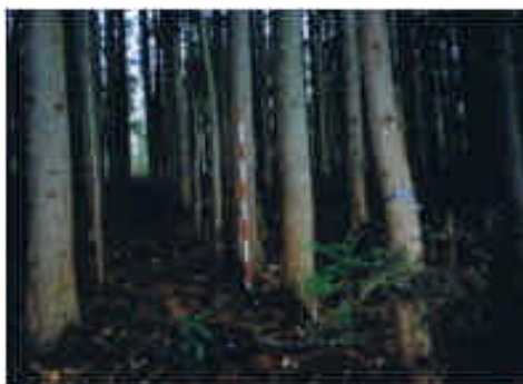
間伐前の状況(下郷町)

一方、森林情報を管理する森林資源情報システムが整備され、電子地図を活用した森林情報をインターネットを通じ県民等に発信する「ふくしま森まっぷ」の運用が開始された。