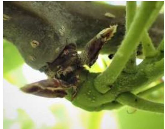
図2 ナシ黒星病の果そう基部病斑