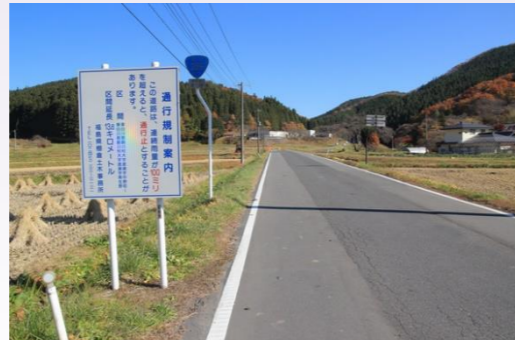
雨量による通行規制の案内表示板