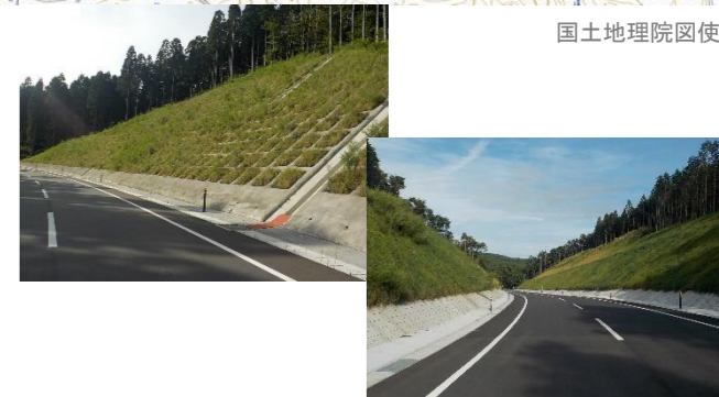
④青生野工区道路改良工事の様子と現在