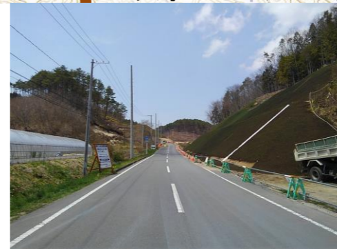
③渡瀬3工区の工事の様子