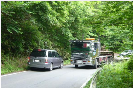
道幅が狭く大型車とのすれ違いが困難な箇所

このため、平成30年代前半の供用開始を目指し、危険箇所を避けた新たな道路として渡瀬バイパスと青生野工区の整備を進めています。