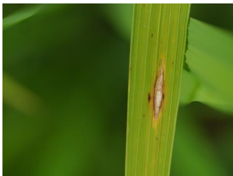
写真1 葉いもちの病斑