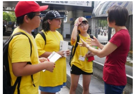
【広島駅前でのPR活動】

田村市立都路小学校の総合的な学習の時間では、「都路を元気にしよう」と、各学年の追究テーマのもと、地域素材や地域人材を十分に活用して学習を進めています。昨年は「きゅうりジャム」の実践を継承、発展させ、都路のよさをアピールする「都路ハッピースマイル大作戦」を実施しました。6年生の児童は、東京、広島、岡山に出向き、自作のパンフレットを手に、都路のPR活動を行いました。