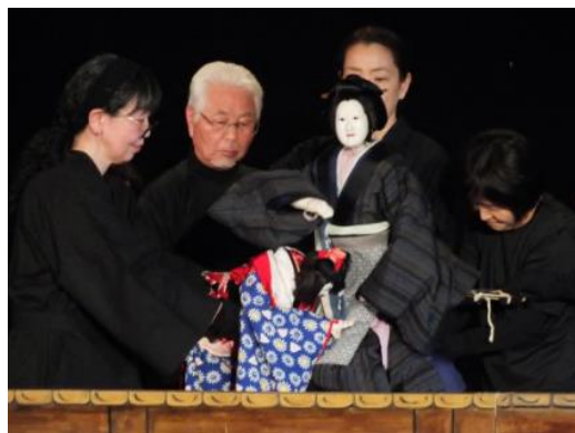
【高倉人形浄瑠璃の発表会より】

日和田公民館は、昨年度、文部科学大臣表彰「優良公民館」を受賞されました。今後も、日和田公民館を核として、地域の人々が交流しながら生き生きと活躍し、地域のつながりがどんどん広がっていくことを期待します。