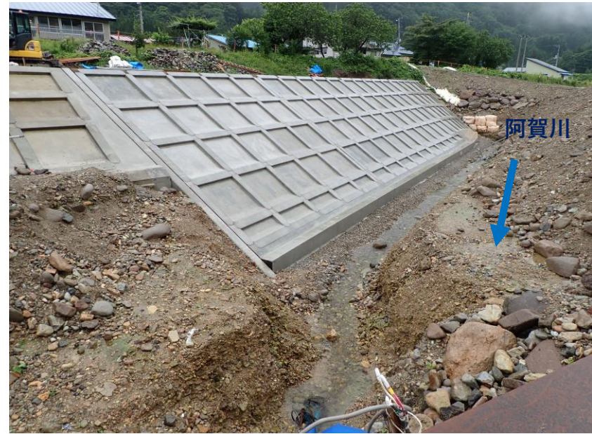
施工状況（令和2年7月18日撮影）