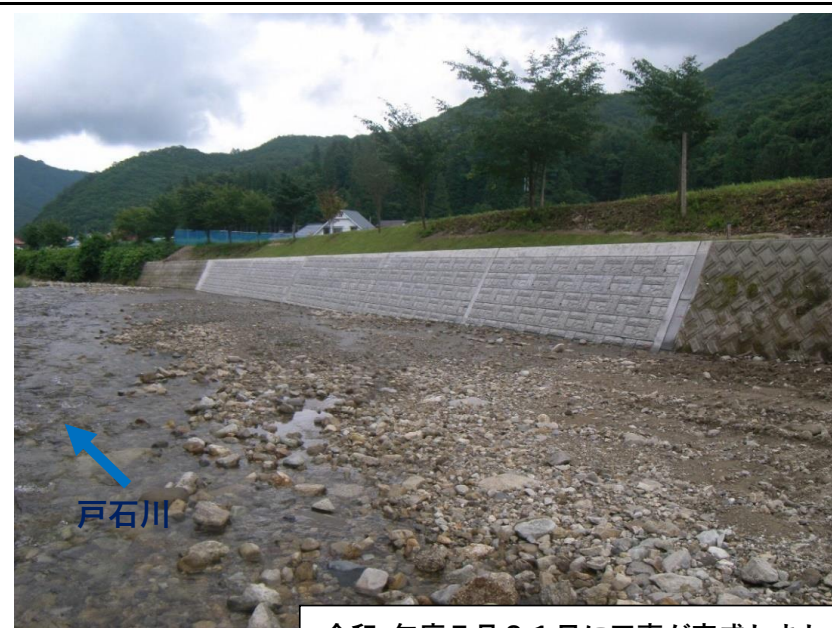
令和2年度7月31日に工事が完了しました