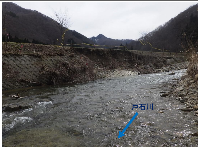
被災状況（令和2年3月25日撮影）