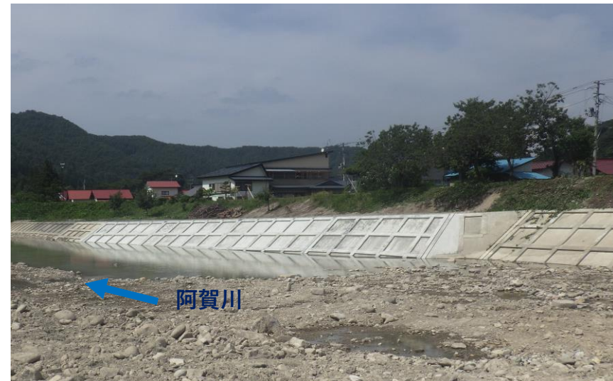
令和2年8月5日に工事が完成しました。