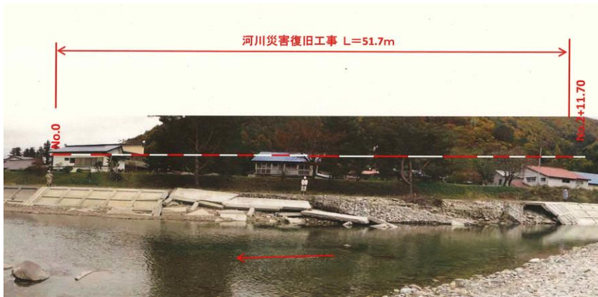
被災状況（令和元年10月撮影）