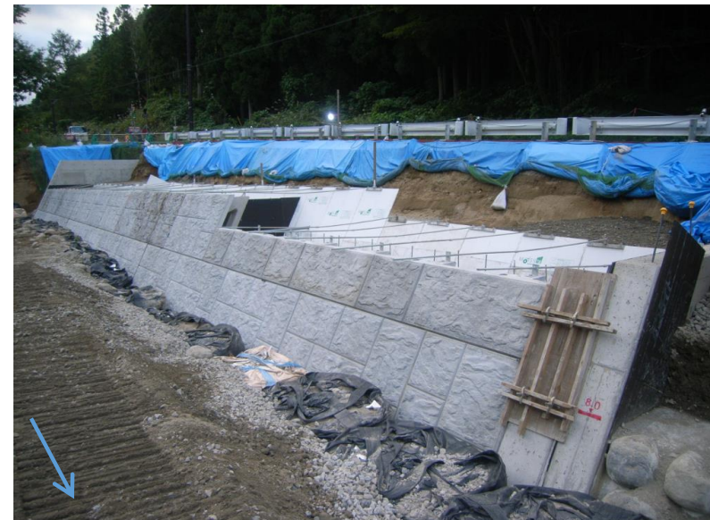
施工状況（令和2年10月3日撮影）