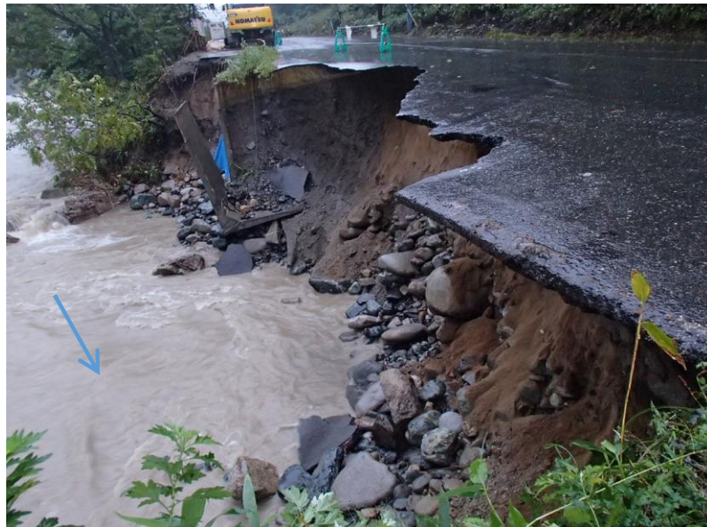
被災状況（令和元年10月13日撮影）