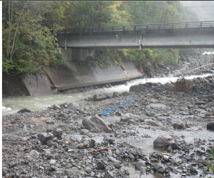
被災状況（令和元年10月15日撮影）