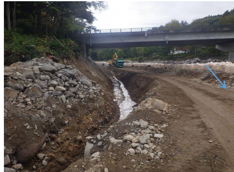
施工状況（令和2年9月25日撮影）