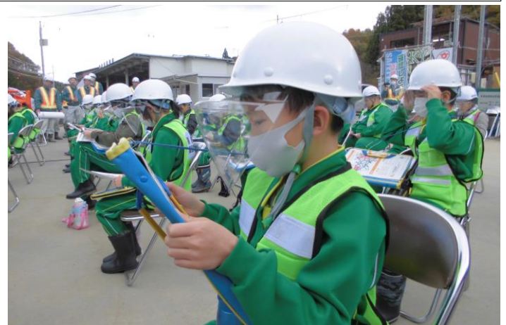
工事の説明を真剣に聞く 川俣小学校の5年生