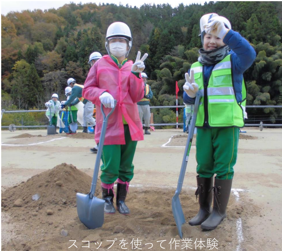
スコップを使って作業体験