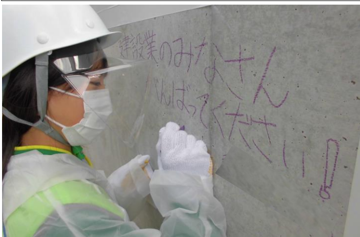
現場のコンクリートブロックに 温かい応援メッセージ

災害から地域を守り、住みやすいまちをつくるなど重要な社会的役割を担う建設業子供たちが建設業を身近に感じ、土木技術やものづくりに興味を持ってもらえたらうれしいです。