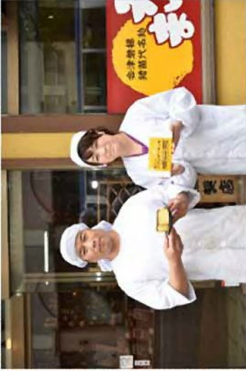
地元企業によるブランド米活用6次化商品