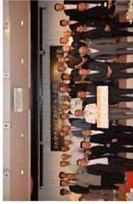
JGAP（米穀）団体認証取得祝賀会