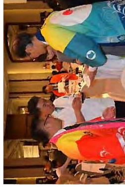
香港でシェフと会談する部会員とJA職員