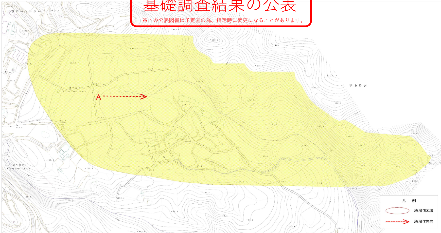
様式-2(地) 土砂災害警戒区域・土砂災害特別警戒区域 区域図