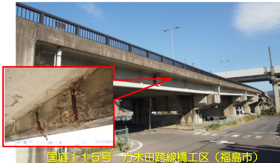
国道115号 方木田跨線橋工区(福島市)