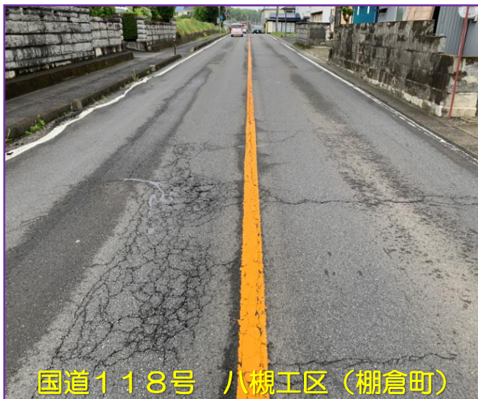
国道118号 八槻工区(棚倉町)