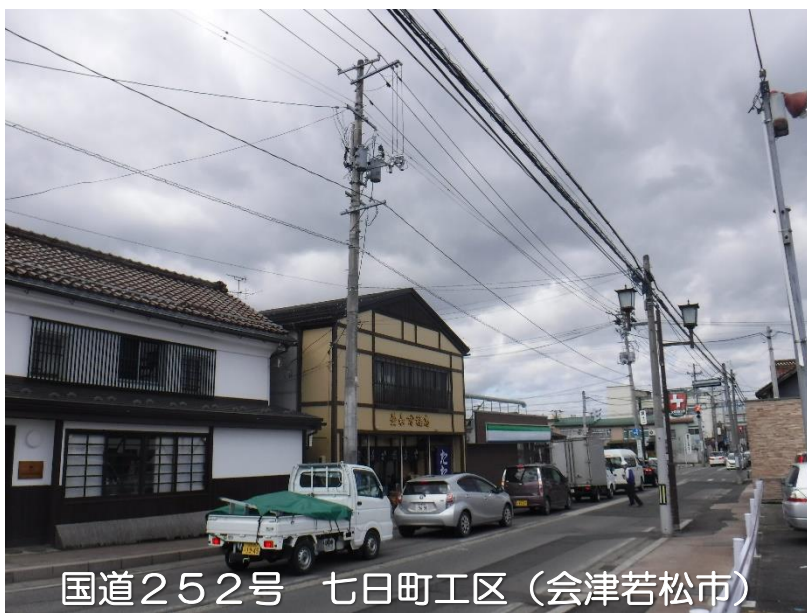
国道252号 七日町工区（会津若松市）