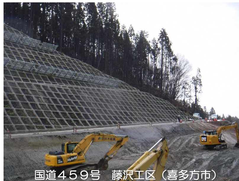
国道459号 藤沢工区（喜多方市）