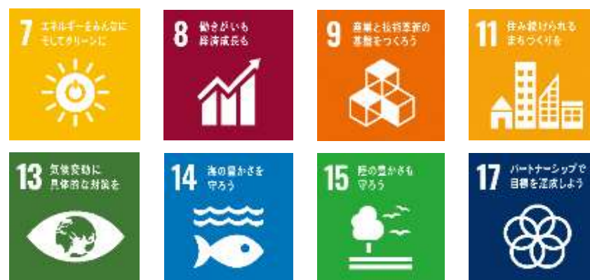
【SDGs（持続可能な開発目標）の視点】

このため、県土の利用については、 公共の福祉 を優先させ、土地の 適正な利用と管理 により自然環境の保全と健康で文化的な生活環境の確保を図る必要があります。また、社会情勢の変化に対応し、県土の 安全性 を高めるとともに、 持続可能 で活力ある県土の形成を図ることを基本理念として、総合計画及び福島県復興計画の基本方針や SDGs の視点を踏まえ、総合的かつ計画的に行うものとします。