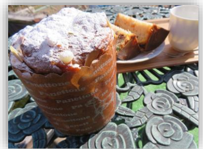
（郡山市産にんじんを使用した ドライフルーツパン）