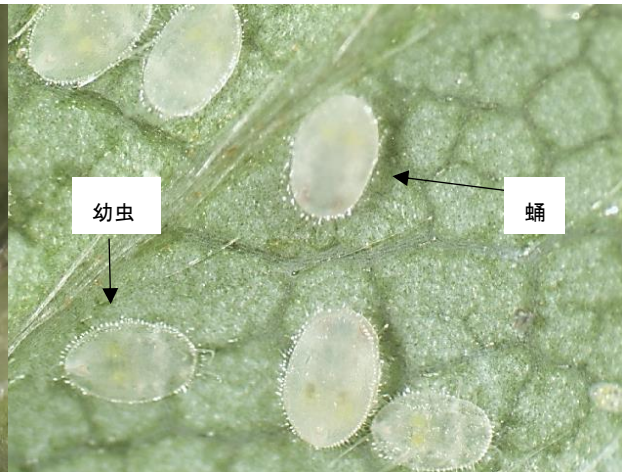
図2 オンシツコナジラミ幼虫、蛹