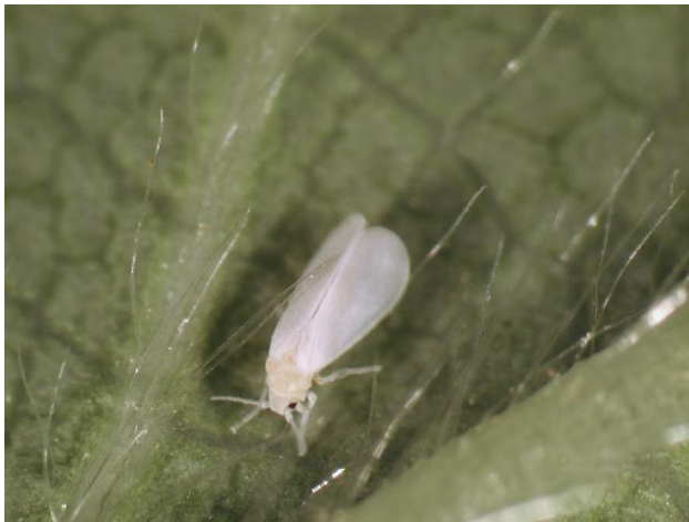
図1 オンシツコナジラミ成虫

成虫の体長は1mm内外、全身が白色粉状のロウ物質で覆われている(図1)。幼虫は淡黄色で、老熟幼虫、蛹は外周が厚く盛り上がり円柱状となる(図2)。