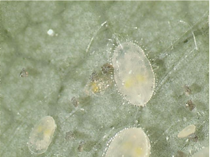
図7 オンシツコナジラミ