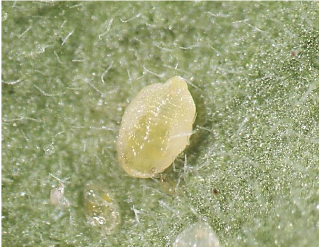
図6 タバコナジラミ