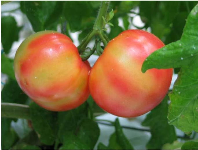
図5 トマトの着色異常果(バイオタイプQによる)

直接的被害として成・幼虫の排泄物によるススが発生するほか、オンシツコナジラミとは異なりトマト果実の着色異常をひきおこす(図5)。また、間接的被害としてトマト黄化葉巻病(TYLCV)、トマト黄化病(ToCV)、ウリ類退緑黄化病(CCYV 本県未発生)等のウイルス病を媒介する。