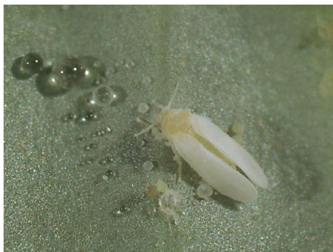
図3 タバコナジラミ成虫

成虫の体長は0.8mm程度、体色は淡黄色で白色の羽をもつ。オンシツコナジラミと比較するとやや小型で体色がやや濃い(図3)。蛹は長さ0.8mm～1.0mmで全体が淡黄色、楕円形で背面がやや隆起する(図4)。