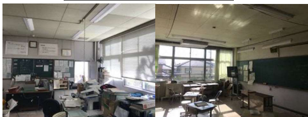
職員室・各教室を5分以上離れる場合は照明をOFFにする取組