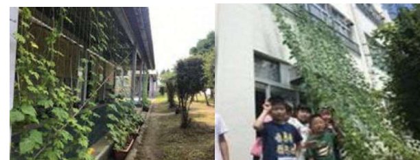
温室効果低減に向けた緑のカーテンの取組