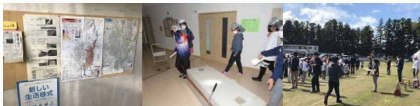
ハザードマップを活用した防災学習