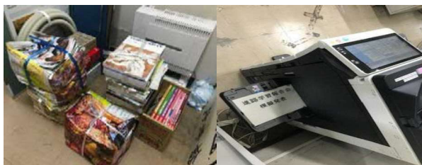
徹底した古紙のリサイクルと裏面利用