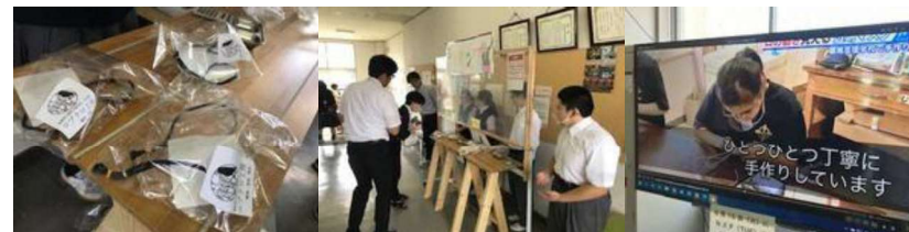
自作透明マスクによる新型コロナウイルス感染症予防対策と熱中症予防対策