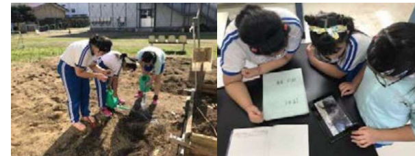
小学部5年理科「流れる水のはたらき」における水害に関する調べ学習