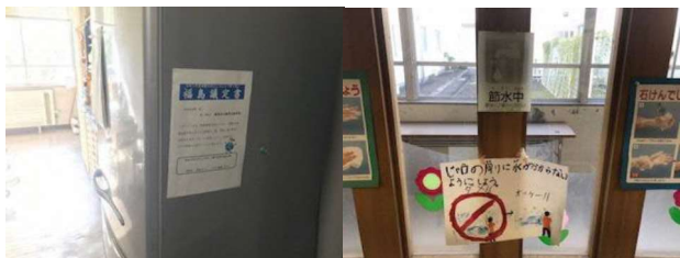
節電・節水に関する啓発のための掲示活動