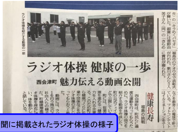
新聞に掲載されたラジオ体操の様子