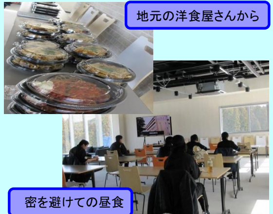
密を避けての昼食