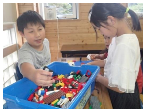
宿題・家庭学習の様子

須賀川市立白江小学校の白江わくわく広場は、平成19年度に開設された放課後子ども教室です。第1学年から第6学年まで62名が登録しています。放課後から16：40までが主な活動時間となっており、入室した子どもから順に自分から宿題を済ませ、その後は自由遊びが中心となります。「楽しい放課後づくり」をモットーに季節のイベントや料理、工作、お祭りなど様々な体験活動が行われています。