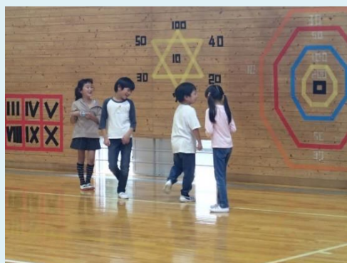
仲良く鬼ごっこの様子

こちらの教室には、7名のスタッフが登録しており、毎日4名体制で支援に当たっています。主な活動場所は体育館で、2階のミーティングルームが学習や工作の場、アリーナではバドミントンや長縄跳び、バスケットボールなどで、1年中子どもたちの声が響き渡っています。体育館2階のギャラリーは暖房が効くため、工作や冬場の活動の場となっています。季節に応じた秋祭りやハロウィーンパーティー、お別れ会などのイベントも子どもたちが大変楽しみにしています。この日は、授業の終わった低学年の児童から順に入室し、宿題を済ませた後は、自由に活動していました。体育館ではスタッフの方と一緒に鬼ごっこをしたり、ミーティングルームでレゴブロックで遊んだりと明るく活動していました。とても暑い日だったため、スタッフの方が準備した冷たい麦茶をおいしそうに飲む姿が見られました。スタッフの方々の指示によく従い、元気に活動し、明るい挨拶や笑顔が印象的な子どもたちでした。伝統ある子ども教室でスタッフの方々の創意・工夫があり充実した子ども教室運営が展開されています。