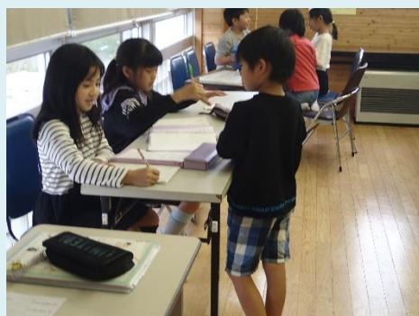
宿題・家庭学習の様子