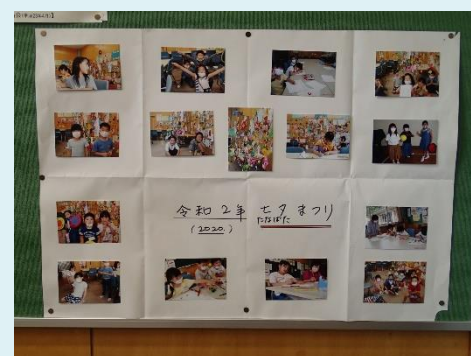
〈七夕まつりの様子の掲示〉