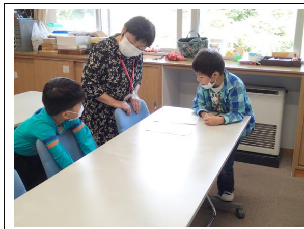
スタッフの方との楽しい会話

田村市立美山小学校の美山めだかの学校は、平成19年度に開設された放課後子ども教室です。第1学年から第6学年までの児童50名が登録しています。放課後から16：00（冬期間が15：35）までが活動時間となっており、子どもたちは出席簿に印を付け、今日の活動場所をマグネットで表示してから自由活動をはじめます。15：35～15：50が学習の時間となり、16：00（冬期間が15：45）に集団下校となります。