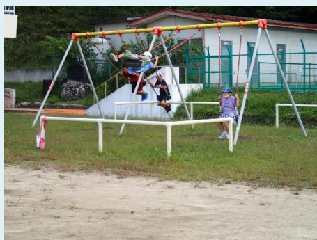
〈自由遊びブランコ乗りの様子〉