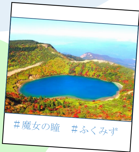
#魔女の瞳 #ふくみず