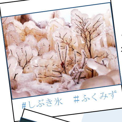
#しぶき氷 #ふくみず