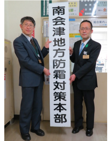
南会津地方防霜対策本部看板設置 (令和3年4月1日 南会津合同庁舎にて)