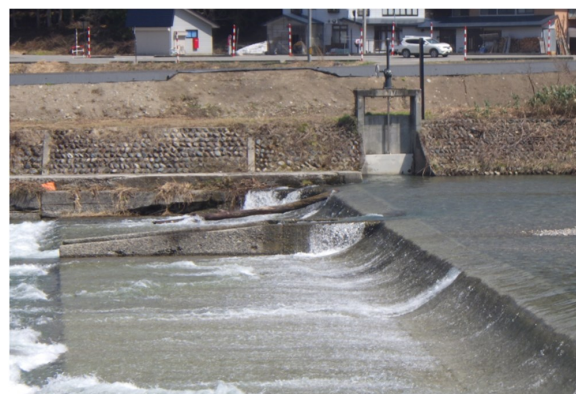
白沢域内取水施設「頭首工」

これは合同による定期的点検の体制を確立した上で、各々が共通した認識の下で今まで以上に適切かつ効率的な維持管理の方法や体制を構築すること、さらに、協議を深めることで施設の長寿命化などの具体的な対策を講じることを目的としています。また、点検で得られた状況や実態を整理していくことで、各施設の中長期的な維持管理計画の立案と同時に、老朽化による不具合や異常気象等突発的な災害時などの迅速な対応にも役立てていきます。