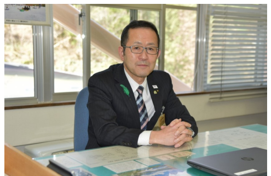
福島県南会津農林事務所長

これからも、現場の声を聴きながら、南会津地域の発展に向けて職員一丸となって頑張っておりますので、皆様の御理解と御協力をお願いいたします。