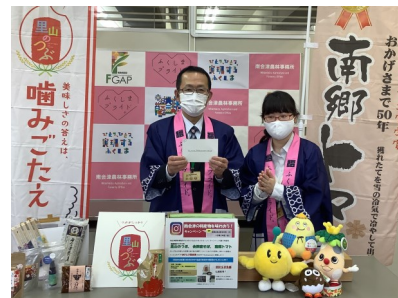
キャンペーン抽選会の様子