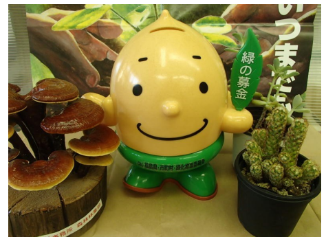
緑の募金キャンペーン マスコット どんぐりくん