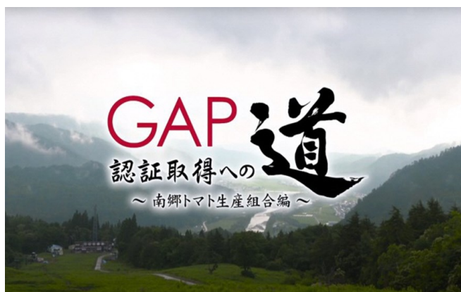
ドキュメンタリー動画の一コマ

動画URL https://youtu.be/hPEd8EEIhNw (農業振興普及部)