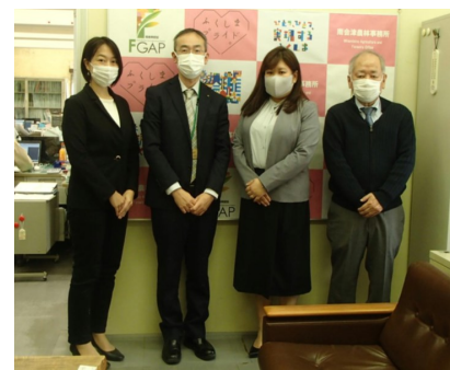
表敬訪問の様子 (宝力代表：右から2番目)