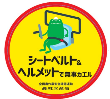
令和3年農作業安全確認ステッカー