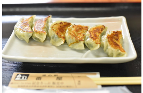
行者ニンニク入り餃子