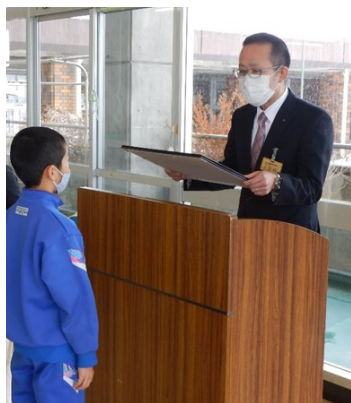
大友所長による賞状贈呈