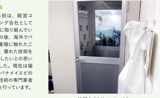
社屋内（クリーンルーム）