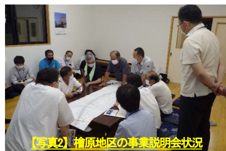
【写真2】檜原地区の事業説明会状況