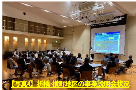
【写真4】折橋・横町地区の事業説明会状況