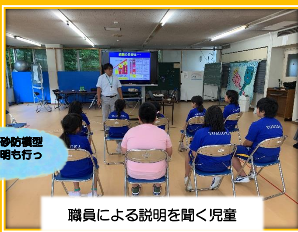
職員による説明を聞く児童