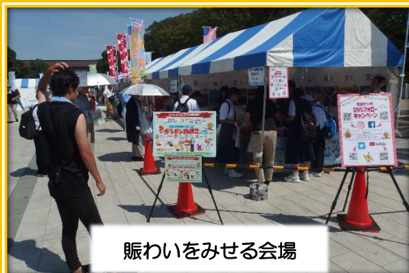
賑わいをみせる会場