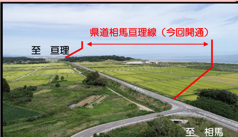
県道相馬亘理線 (今回開通)