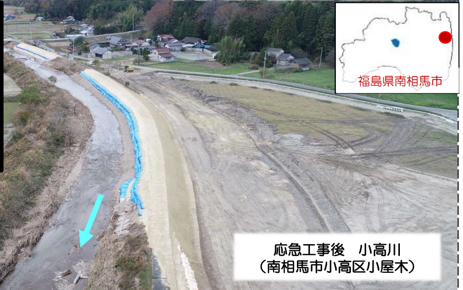
応急工事後 小高川 （南相馬市小高区小屋木）