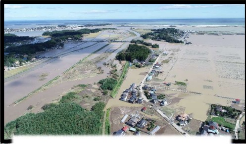
台風第19号 被災直後