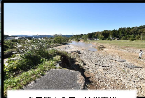
台風第19号 被災直後