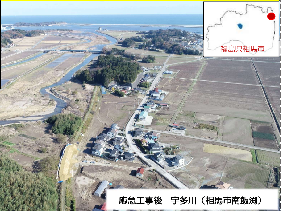
応急工事後 宇多川（相馬市南飯淵）